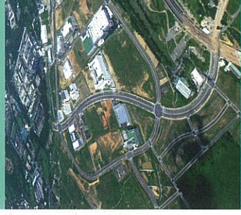
〉台中精密機械科技創新園區

臺中市精密機械園區位處臺中大肚科技走廊工業群落軸帶上，面積127公頃，係臺中市政府為輔導地方傳統優勢之機械產業，使其能於中科落腳臺中之關鍵時刻，打造以顧客為導向的客製化機械產業專區。中興工程顧問公司除規劃一處軟硬體環境俱優的永續發展環境外，更兼顧搶購熱潮的情境，首次制定一套完整的預售與甄選機制，不僅在臺灣工業區銷售史上寫下招商績效最亮麗的新頁，也順利協助市府完成輔導具創新轉型廠商進駐設廠，加速地方產業升級的目標。